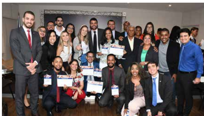
Equipes de oito faculdades participaram do Júri Simulado

Desde o início da pandemia do novo coronavírus no Brasil, em março de 2020, houve a necessidade de suspensão dos cursos presenciais, em virtude do isolamento social. No entanto, a plataforma online ganhou bastante força e todas as aulas virtuais foram disponibilizadas de maneira gratuita para a classe. O alcance foi tamanho que chegou a profissionais e estudantes de Direito de outros estados além da Bahia.