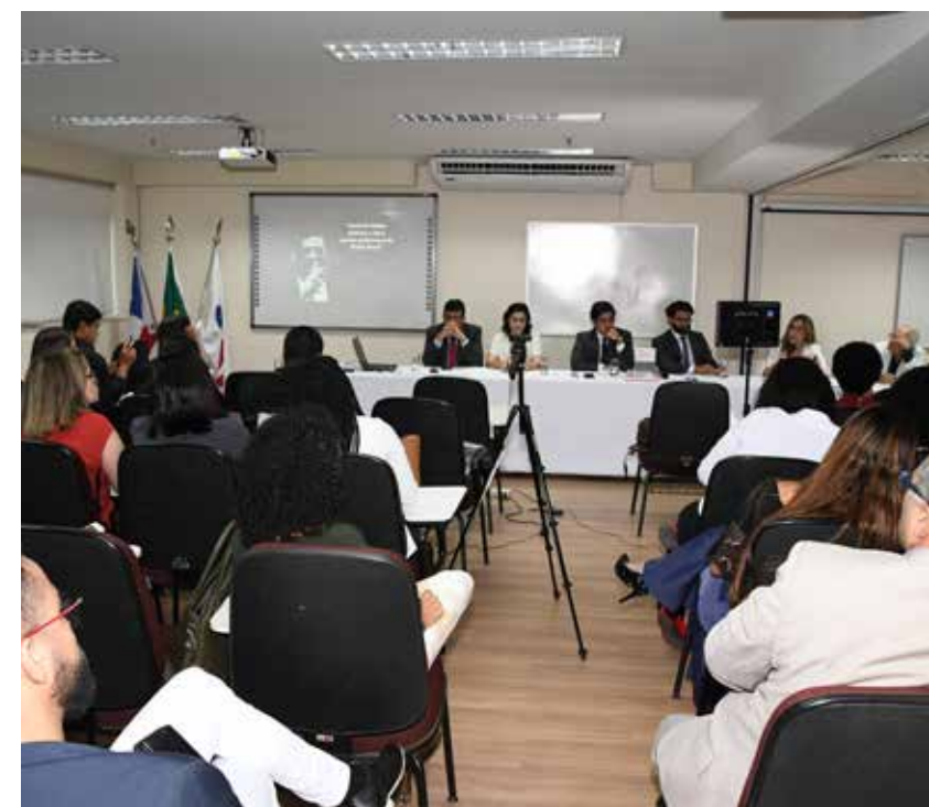
Debate sobre pacote anticrime