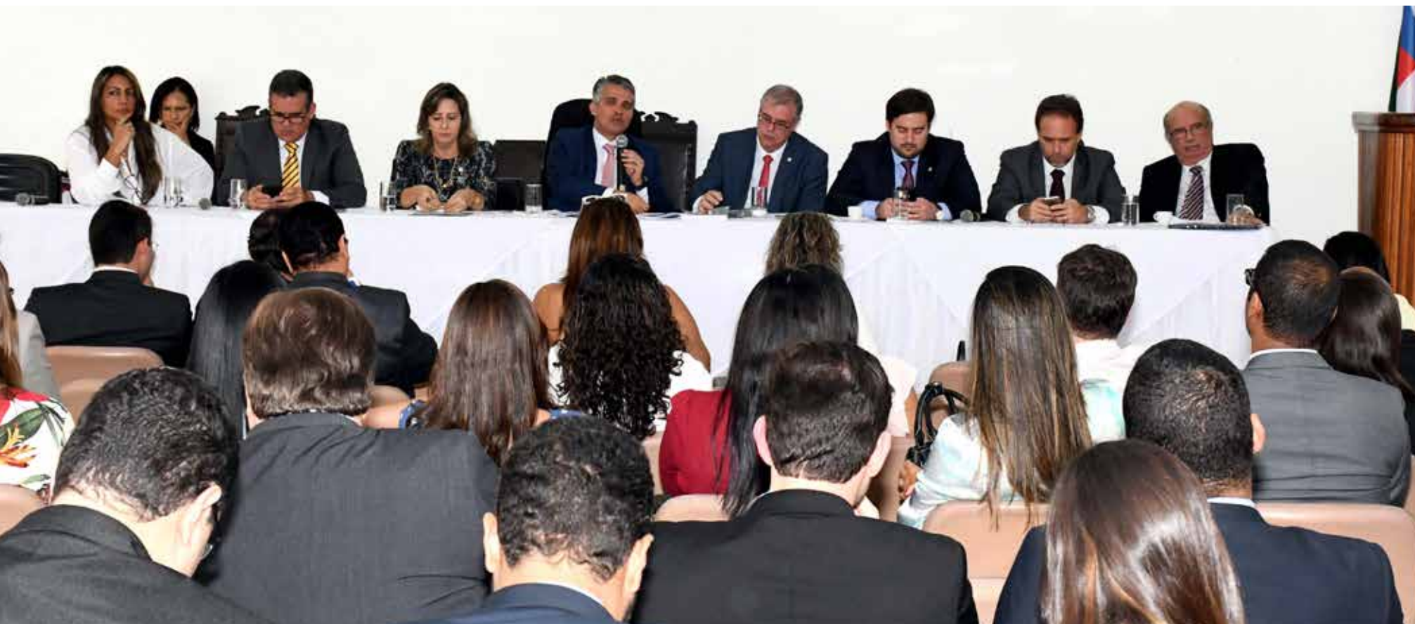
Conselho Pleno da OAB-Ba se reúne em sessão ordinária