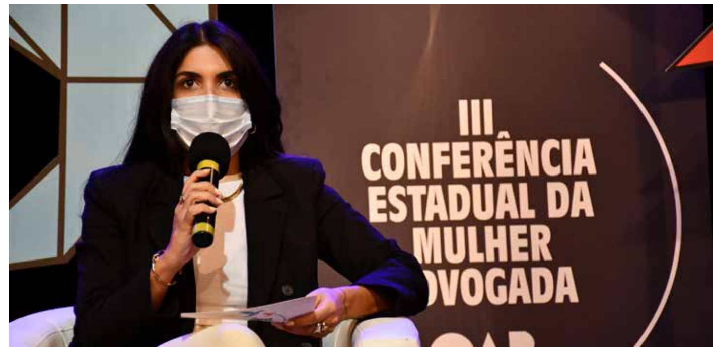
III Conferência Estadual da Mulher Advogada da OAB-BA

Transmitido pelo YouTube e pela plataforma Zoom, foi considerado o maior congresso virtual da jovem advocacia durante a pandemia. A abertura chegou a reunir