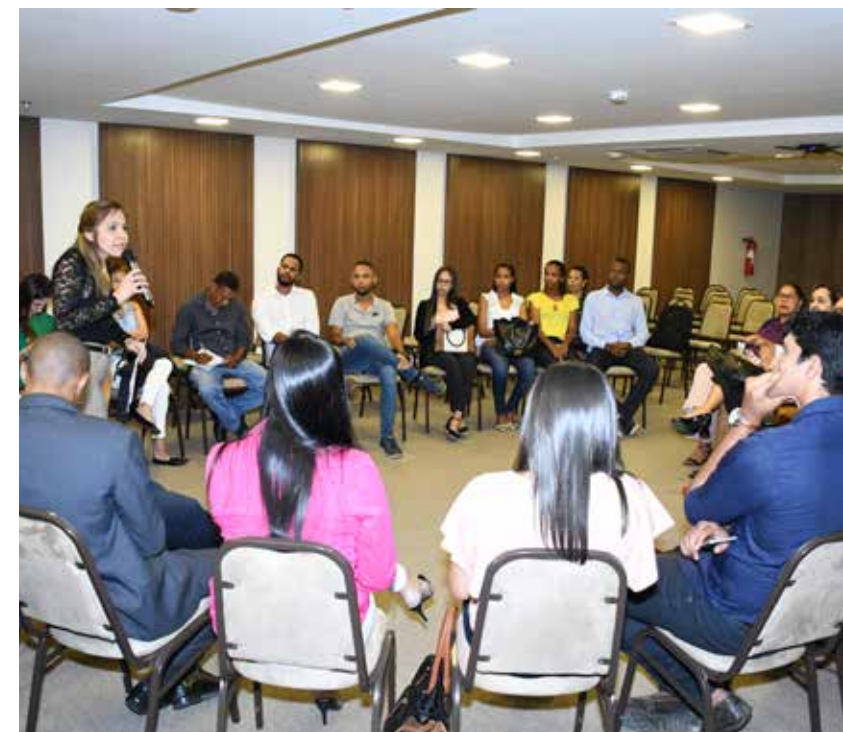
Debate sobre a reforma trabalhista