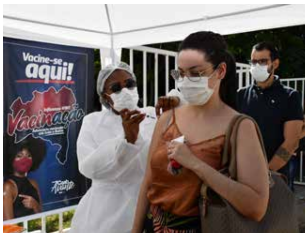
Campanha de vacinação contra a gripe