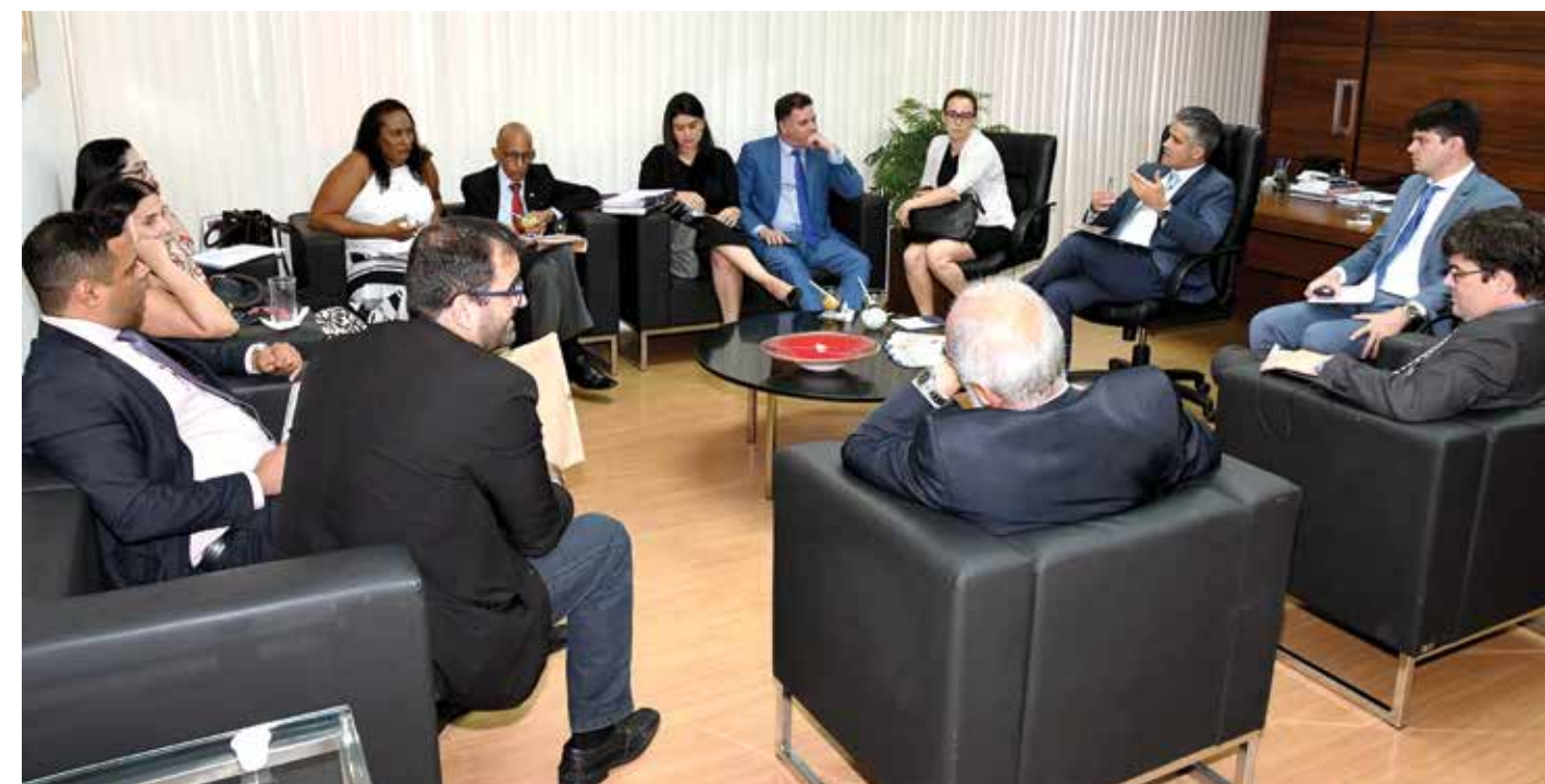
Reunião da Câmara de prerrogativas na sede da OAB-BA

Ainda nos primeiros dias de pandemia, a Comissão de Direitos e Prer-