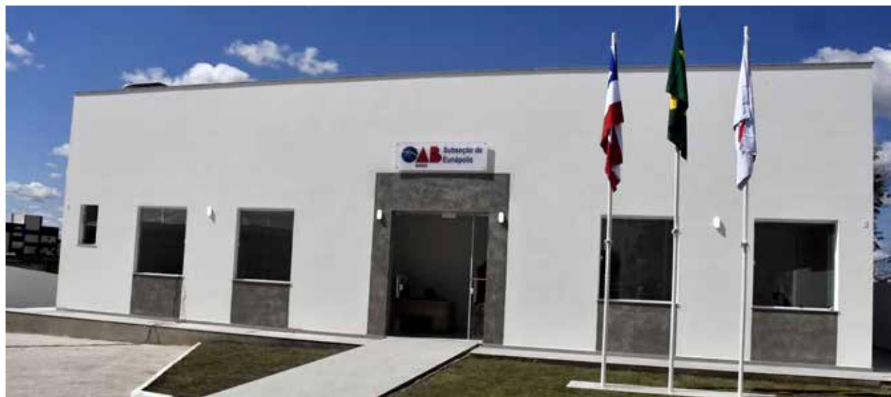
Sede da Subseção de Eunápolis