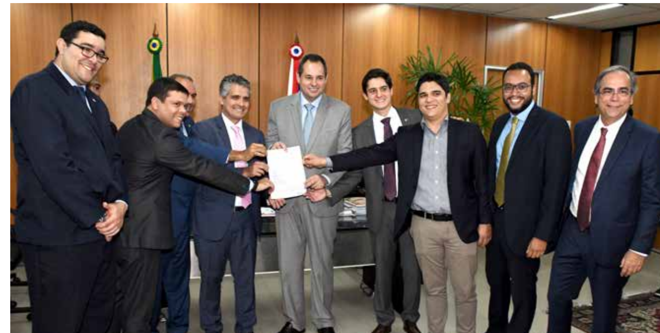
Assinatura do convênio entre a TV ALBA e a OAB da Bahia