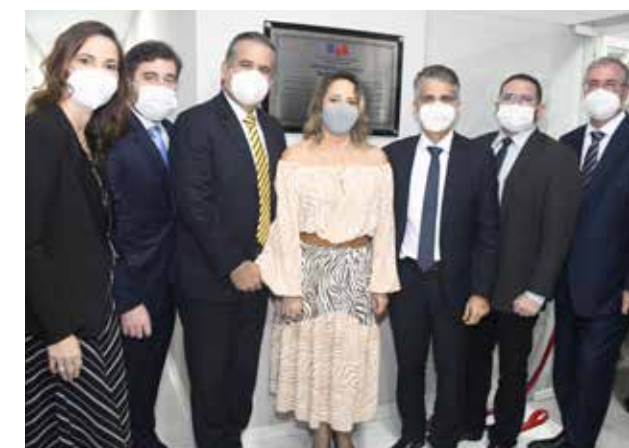
Inauguração da sede da Subseção de Juazeiro

as subseções de Camaçari, Eunápolis, Juazeiro, Lauro de Freitas, Cruz das Almas e Vitória da Conquista tiveram suas sedes construídas ou reformadas. Além disso, a Seccional inaugurou outras 37 salas da advocacia (vide tabela).