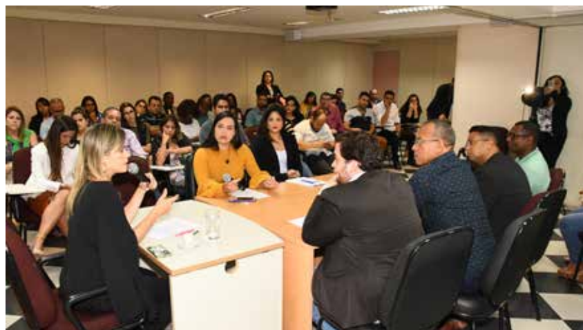
Estudantes e jovens advogados participam da competição Júri Simulado