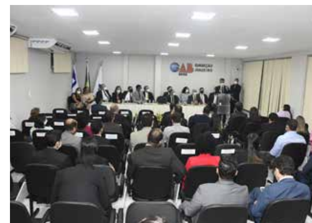
Inauguração da sede da Subseção de Juazeiro