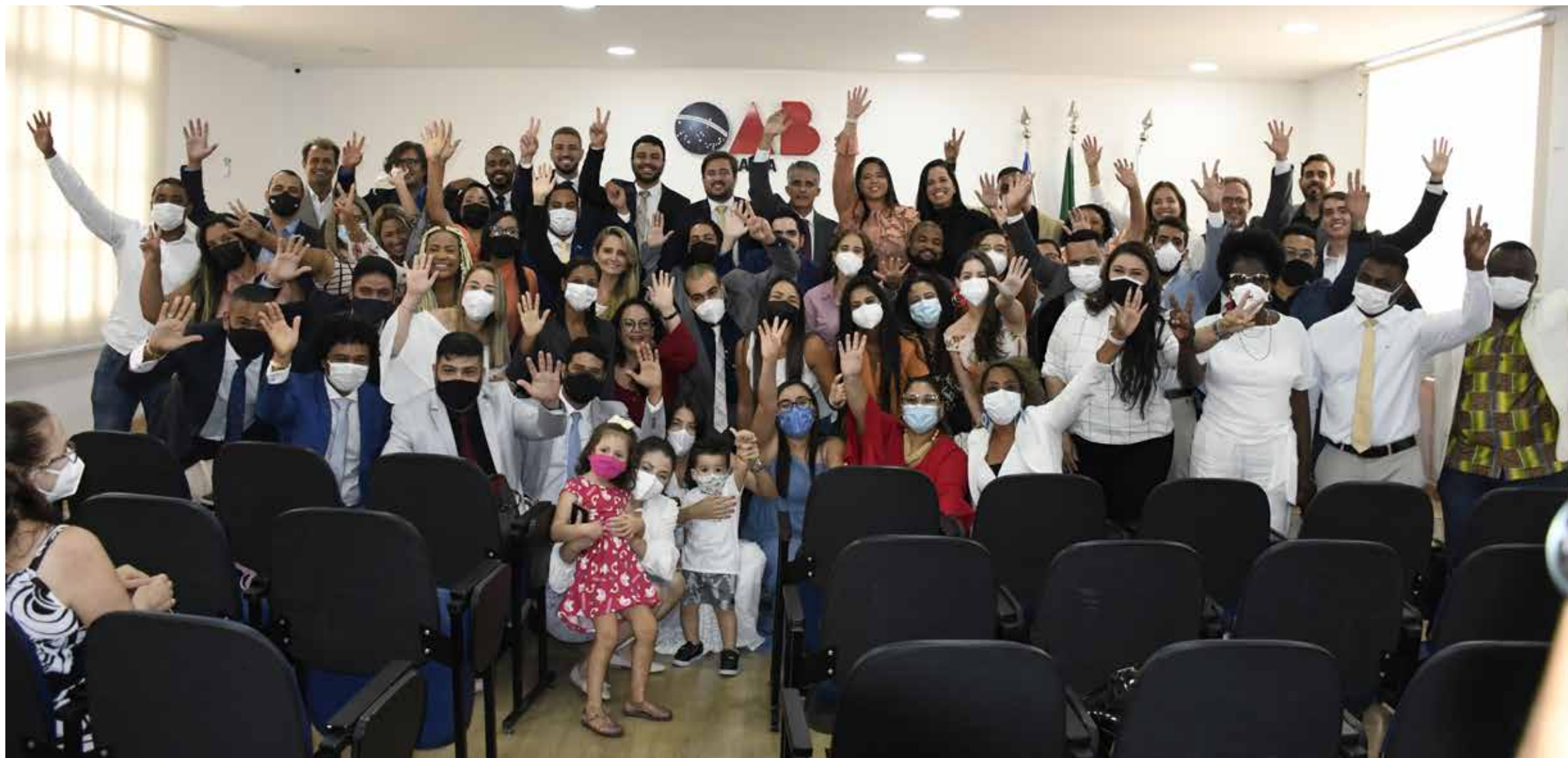
Sessão de encerramento do CCJA no triênio 2019-2021