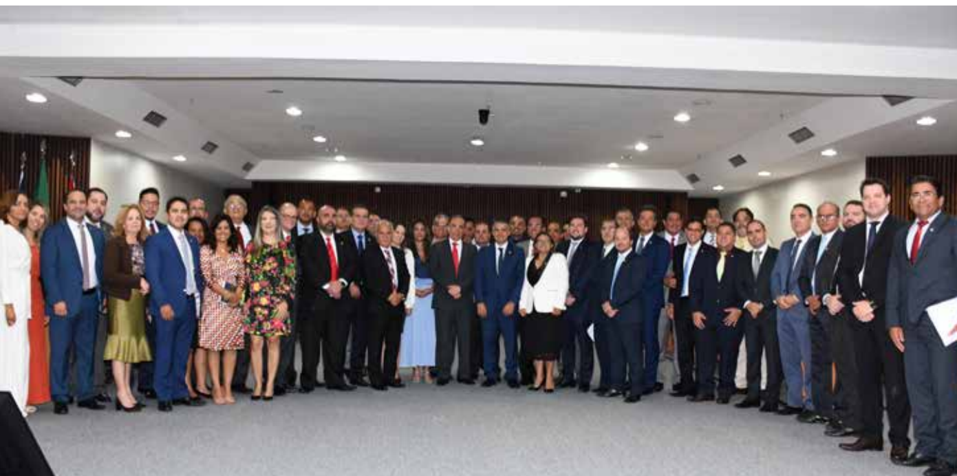
Os presidentes das subseções do interior tiveram um importante papel no enfrentamento da crise do judiciário no estado.