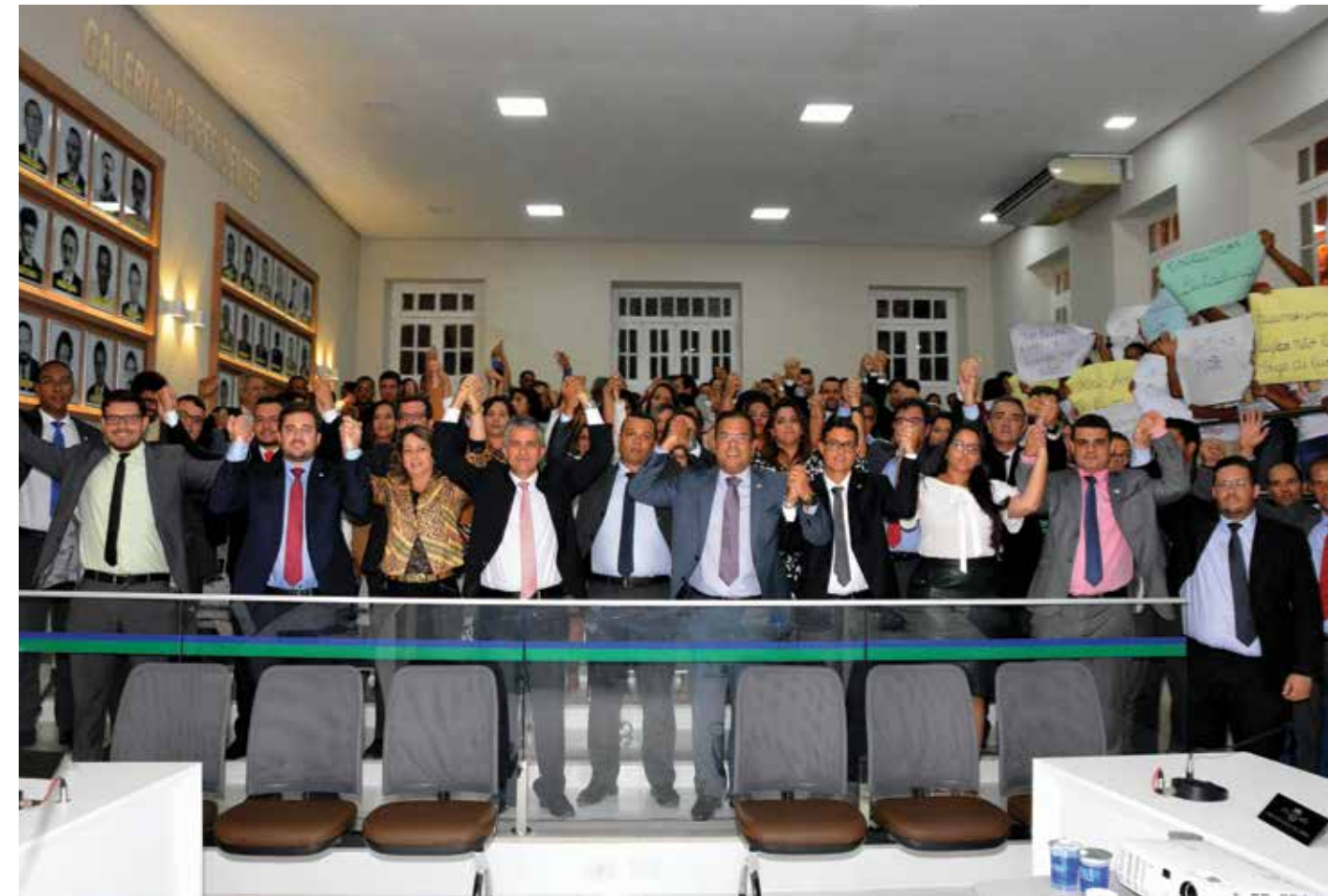
Desagravo de jovem advogado em Itaberaba