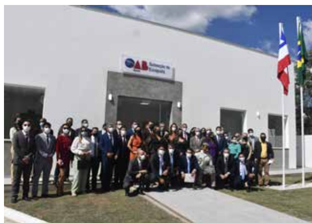
Reinauguração da sede da Subseção de Eunápolis