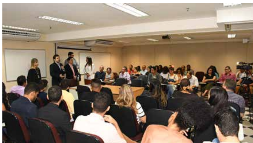
O Júri Simulado foi uma parceria da ESA com a OAB Jovem