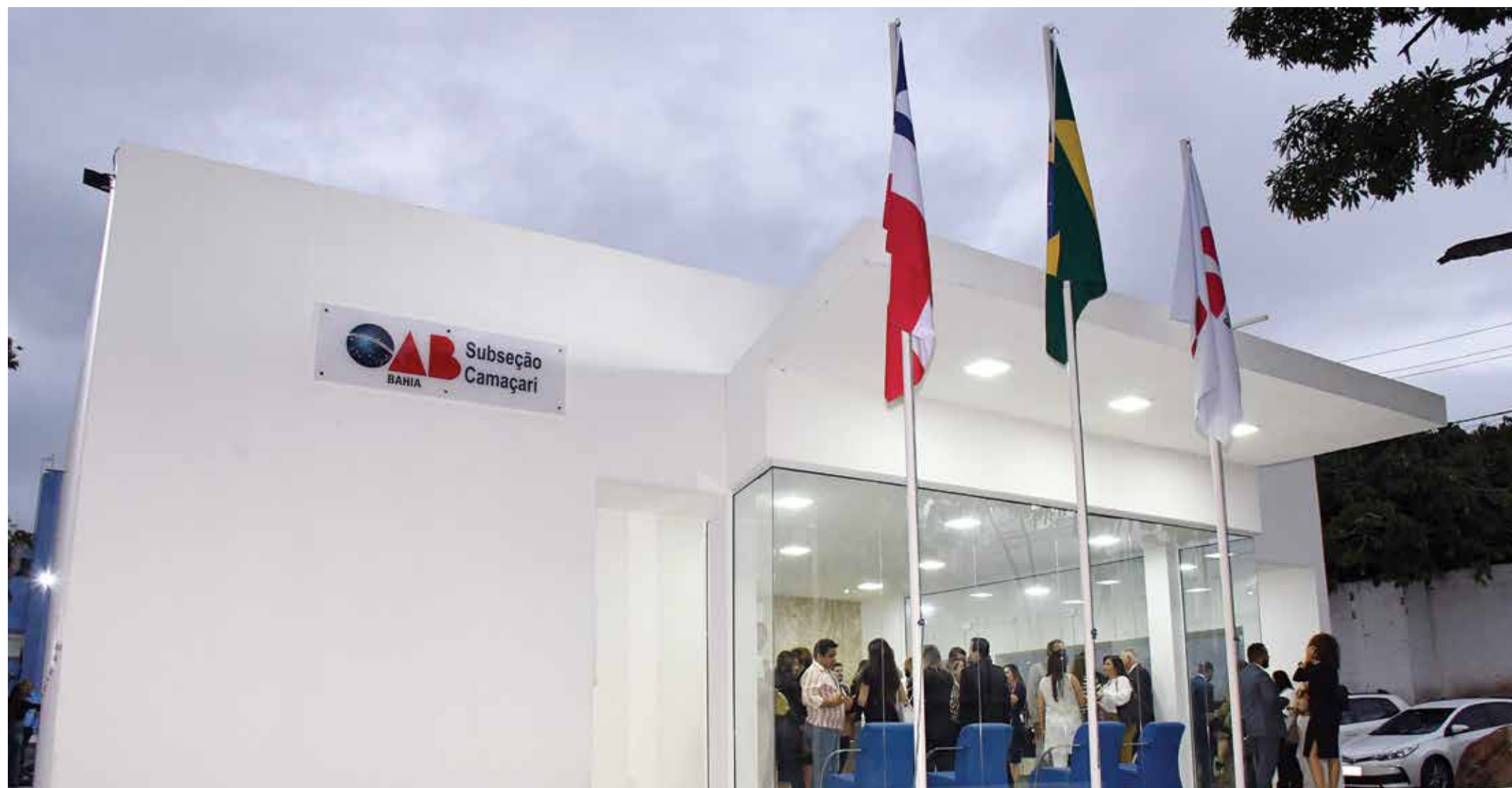
Inauguração da sede da Subseção de Camaçari