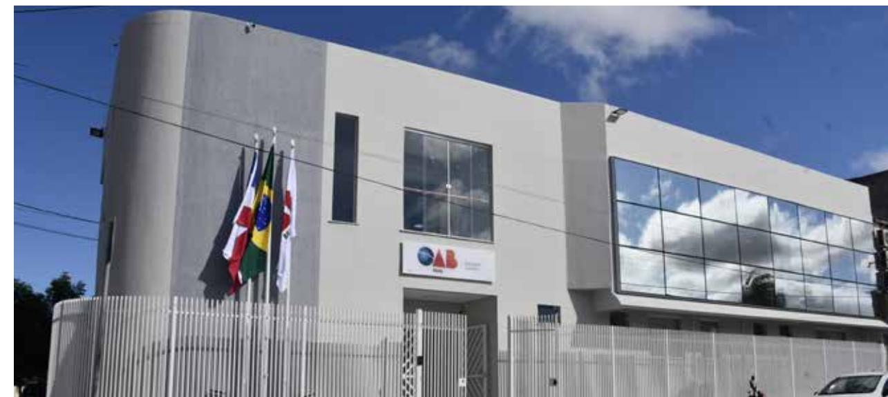
Sede da Subseção de Juazeiro